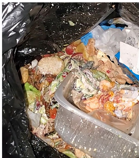
Рис. 2. Обычное состояние еды в мешках

Обычно еда всё-таки разделена осмысленным образом — в одном мешке лежат салаты и лапша, в другом — котлеты и бутерброды,