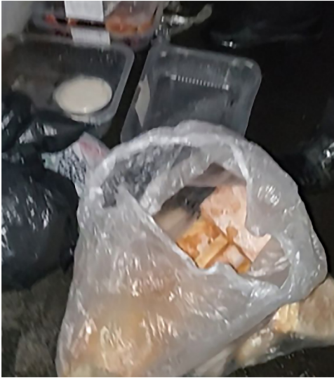
Рис. 1. Сортировка найденных продуктов

себе второй, непокрытой рукой, чем минимизирует положительный вклад другого пакетика.