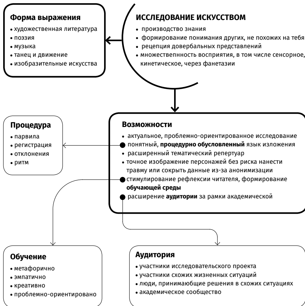
Рис. 3. Концептуализация исследования искусством

принципов объективного познания, отказ в стремлении к объективности. Задача исследования искусством — не дать ответ, а привести к диалогу, к размышлению [Seregina, 2020; цит. по: Meamber, 2023, p. 99]. Зачастую такую позицию связывают с качественной парадигмой в социальных исследованиях [Archibald, Makinde, Tongo, 2024; Love, Randolph, 2024, p. 143-150], однако ограничения и недопустимость диктата объективного знания давно стали общим методологическим принципом и, например, явно обозначены уже в постпозитивистских концепциях познания.