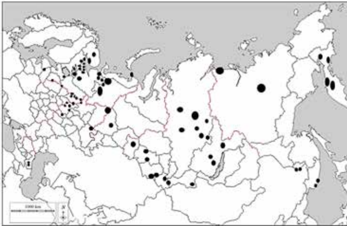
Рис. 1. Карта-схема распределения обследованных изолированных местных обществ по территории страны. Размеры закрашенных кружков (овалов) приблизительно соответствуют площади территории, контролируемой населением обществ, за исключением южных и центральных регионов России (где эти территории гораздо меньше). Контролируемые территории не совпадают с административными границами районов, а определяются природными условиями и необходимым объёмом ресурсов для жизнеобеспечения. Границы регионов указаны для справки.

Для целей данного исследования важно отметить что, во-первых, описание местного сообщества/общины всегда осуществляется непосредственно исследователем и по заранее заданной схеме, а, во-вторых, интервью носят преимущественно характер экспертных, поскольку нас особо интересует социально-исторический контекст современного существования сообщества.